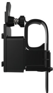
Крепление на руль